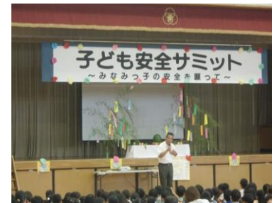
小学校で開催したこども安全サミット

岐阜北地区交通安全協会の事業・活動をご理解頂き、運転免許の更新時『交通安全協力金』にご協力下さるようお願いいたします。