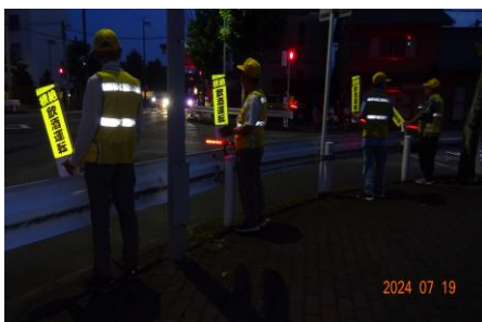
夜間における広報啓発活動