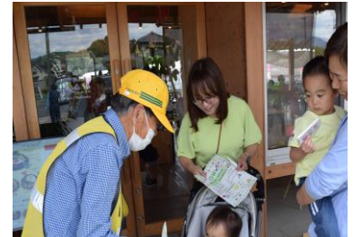
農業施設における広報啓発活動