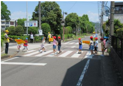
新1年生の交通安全教室