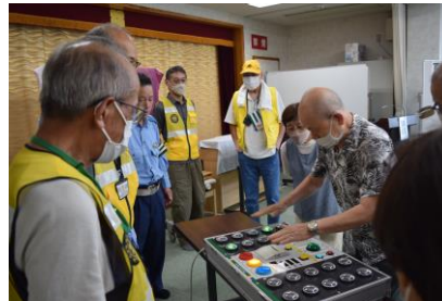
高齢者を対象とした交通安全教室