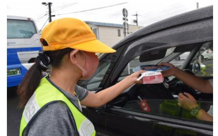
早朝における広報啓発活動