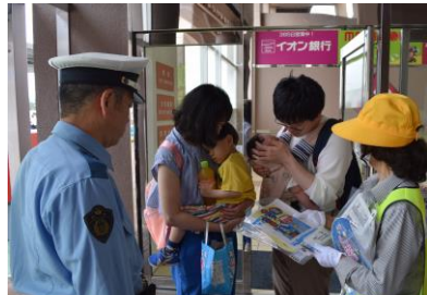
大型店舗における広報啓発活動