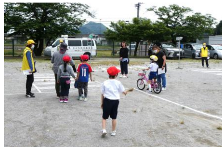
小学生対象の自転車交通安全教室